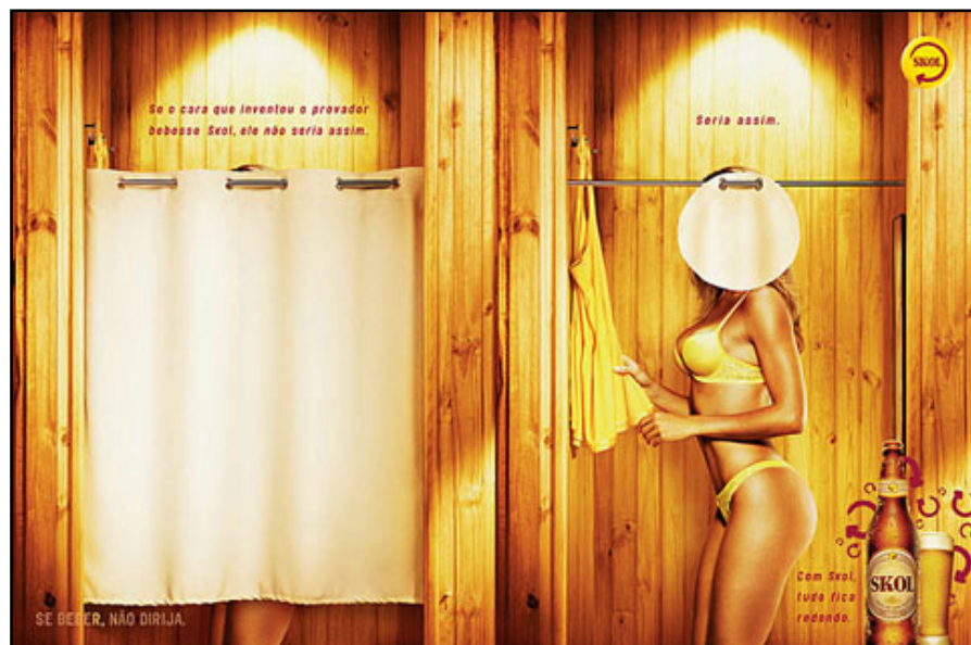
Figura 6 – Anúncio mulher sem cabeça – Skol cerveja (Brasil)